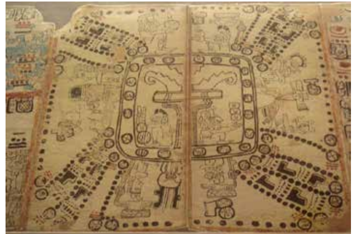
En el Códice de Madrid se muestra la imagen original de la rueda maya, con los ideogramas o glifos de los veinte nawales, las cuatro esquinas del universo y la cuenta de 260 días. Es el primer referente documental antiguo de la existencia del Tzolkin o Cholq'ij.

Estas trece vibraciones que se van sucediendo cada día nos muestran el propósito de una secuencia de toma de consciencia vital y, por tanto, son energías que nos ayudan a afrontar las desarmonías que tenemos. El Tzolkin es pues un calendario de la Consciencia Universal que nos muestra las energías de cada día recibe el planeta con el fin de ayudar a armonizar nuestra vida con la del Universo. Al fin y al cabo, el propósito de la vida es aportar la Luz de una Consciencia Superior en esta dimensión para unir el Espíritu y la Materia.