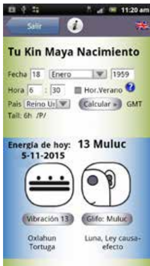
APP, brújula de tu destino